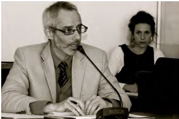
Taller sobre política de seguridad ciudadana | Montevideo | 15.6.2015