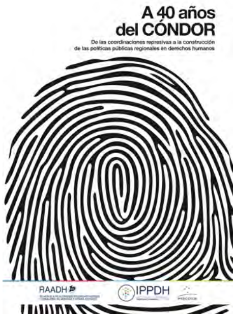
Libro editado por IPPDH presentado en Paraguay