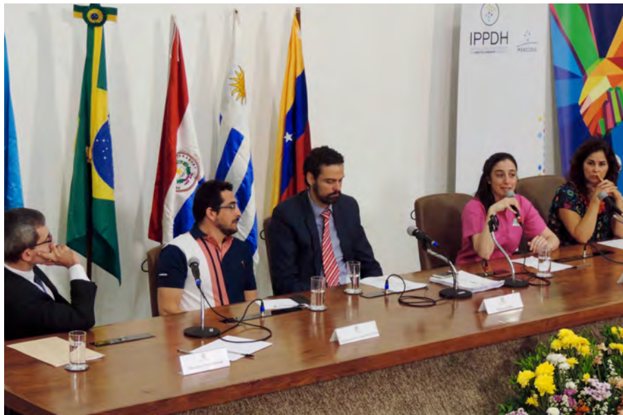
II Consulta Pública | Brasília | 25.9.2015