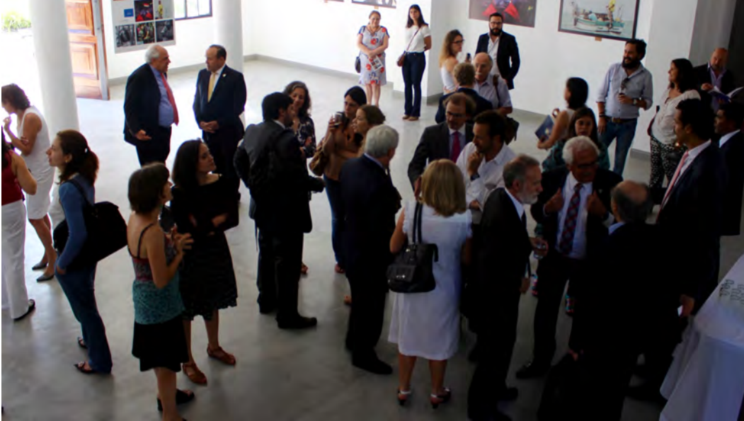
Apertura de la muestra fotográfica Mirada del SUR | Sede del IPPDH, Buenos Aires | 9.12.2015