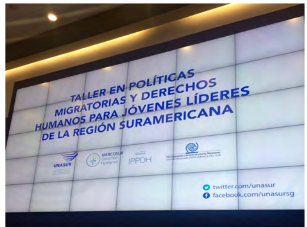
Taller en políticas migratorias | Mitad del Mundo, Ecuador | 23 a 25 .11.2015