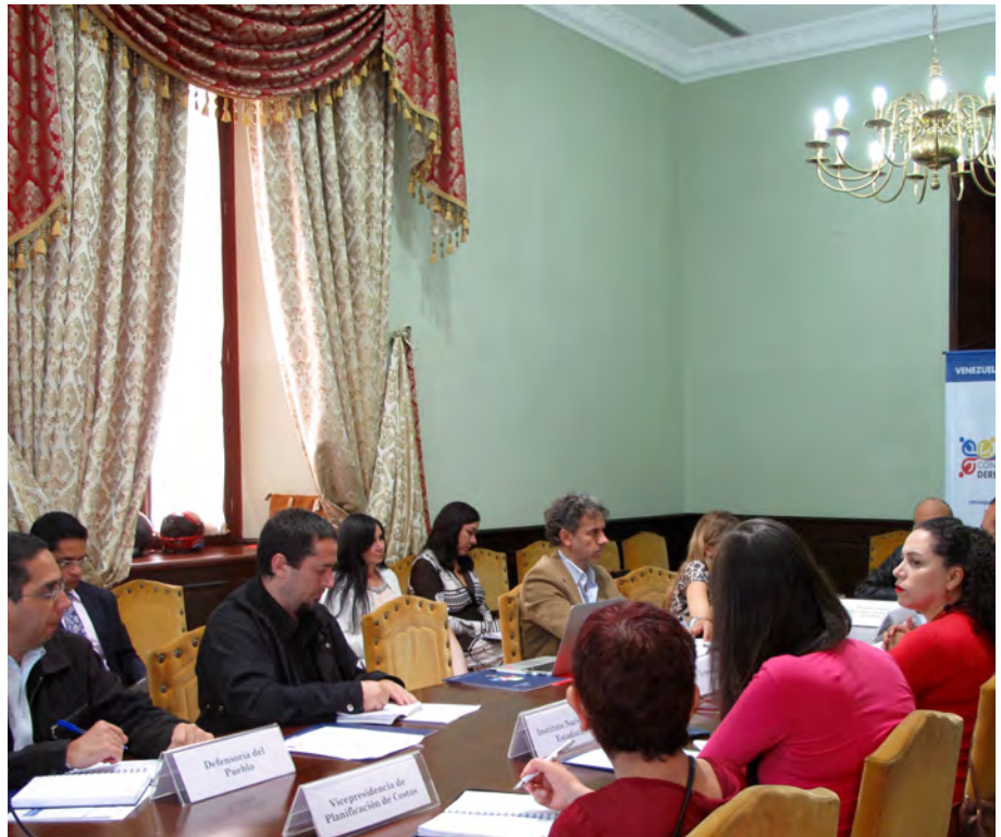
Mesa técnica sobre derechos humanos | Venezuela | 22.5.2015