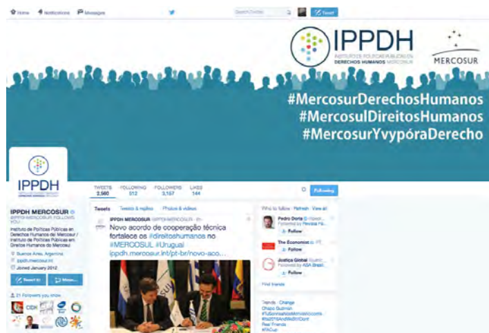
Perfil oficial del Twitter: twitter.com/IPPDHMERCOSUR