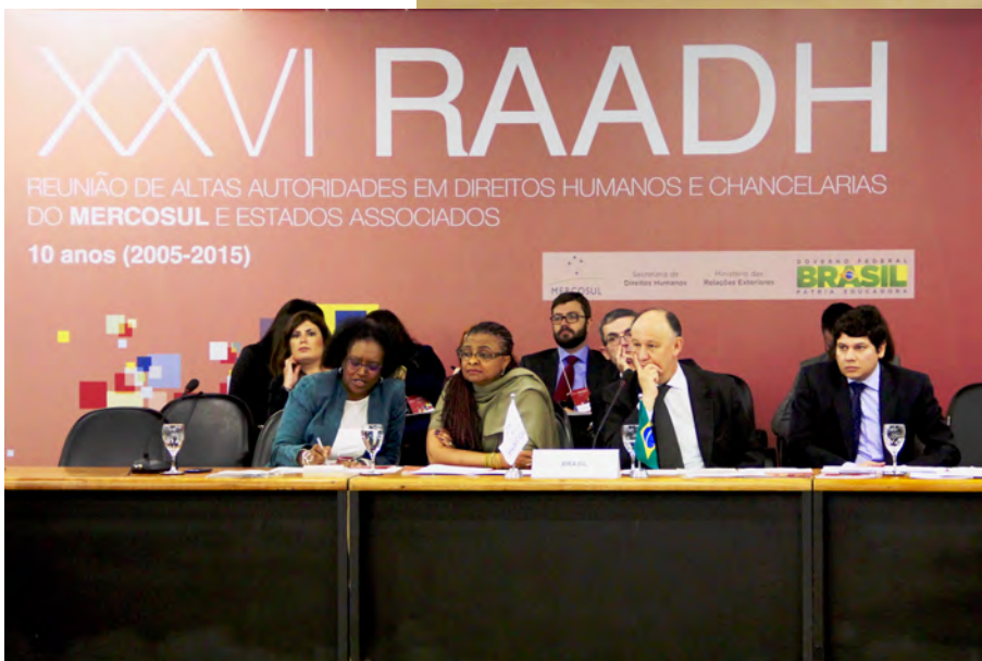
RAADH | Brasília | 6.7.2015