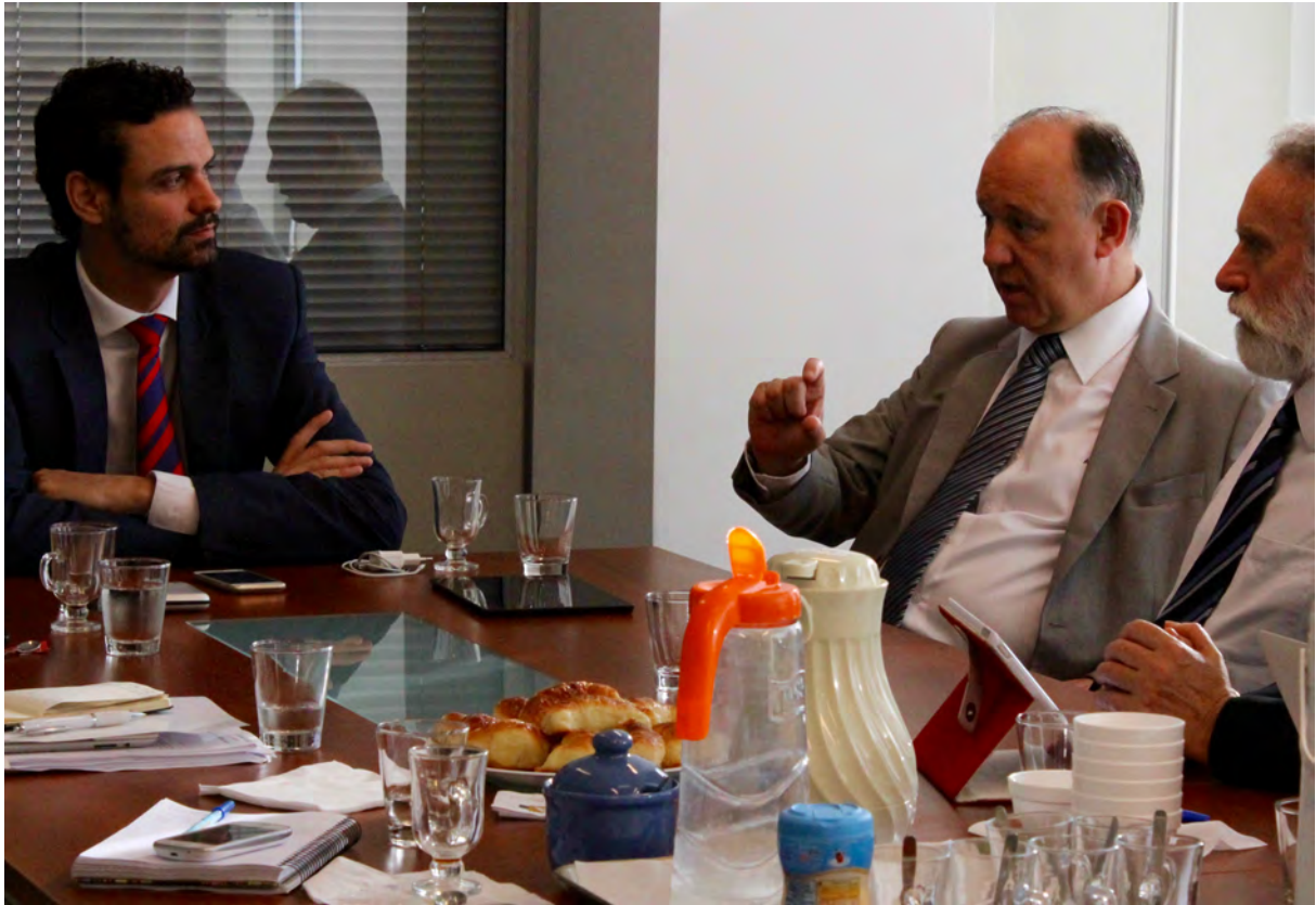
Reunión de autoridades en derechos humanos | Buenos Aires | 2015