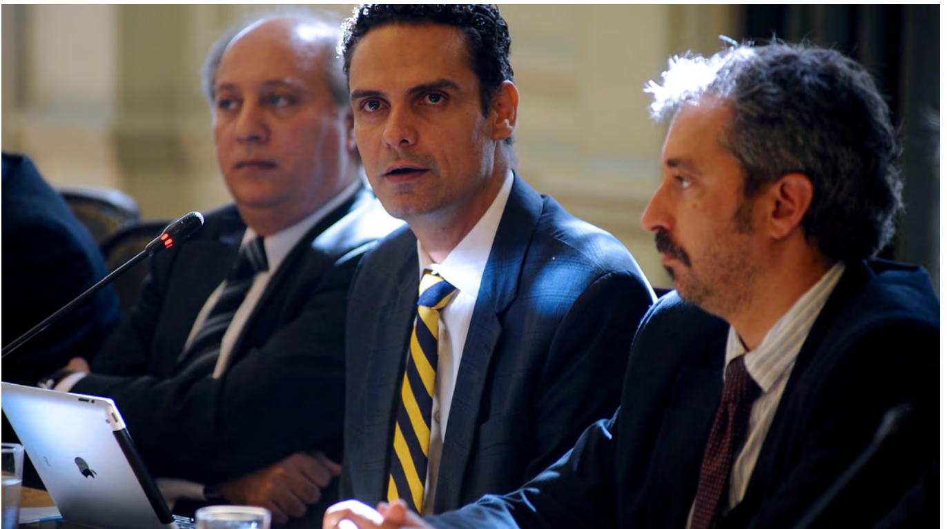
Traspaso de mando institucional | Buenos Aires | 12.3.2015