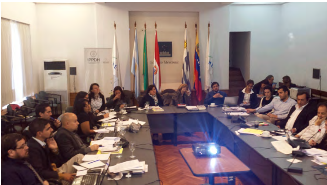
Taller sobre política de seguridad ciudadana | Montevideo | 15.6.2015