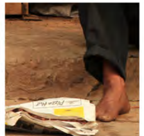
Catálogo de la muestra fotográfica Miradas del SUR