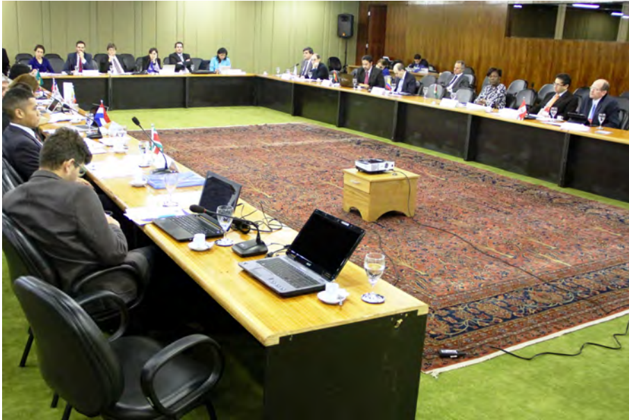
GAN UNASUR | Brasília | 7.7.2015