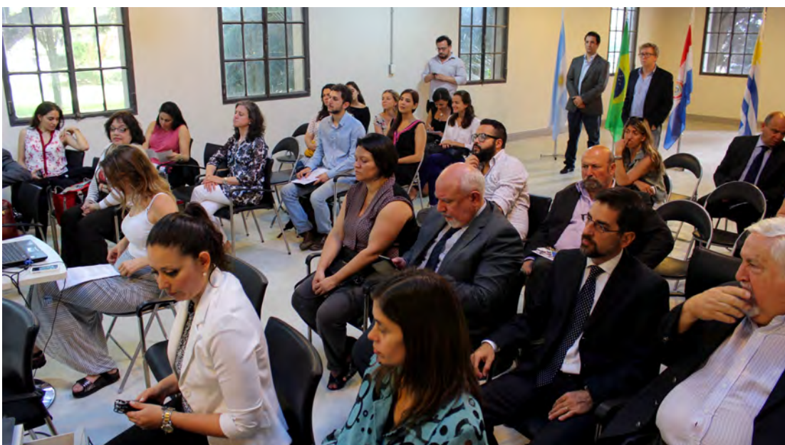
Lanzamiento de la Escuela Internacional Derechos Humanos | Buenos Aires | 9.12.2015