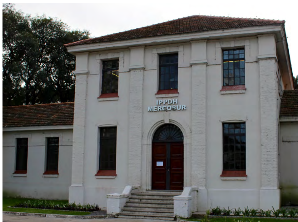
Sede del IPPDH | Buenos Aires