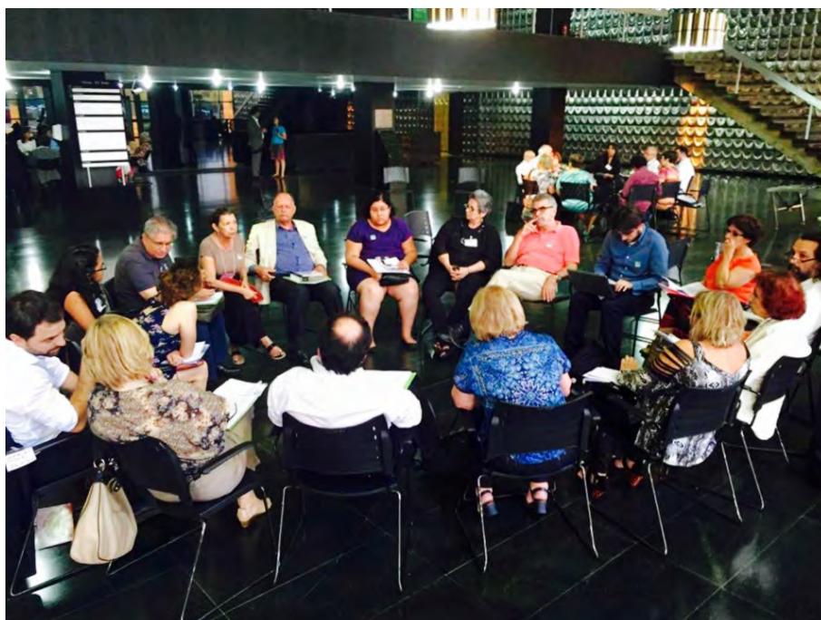
II Consulta Pública | Brasília | 25.9.2015