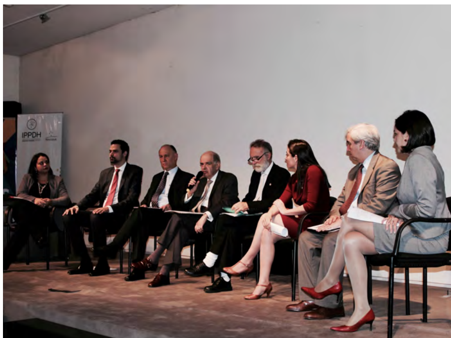
I Consulta Pública | Buenos Aires | 20.5.2015