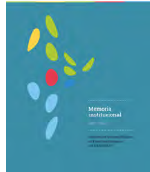
Memoria Institucional 2009/14