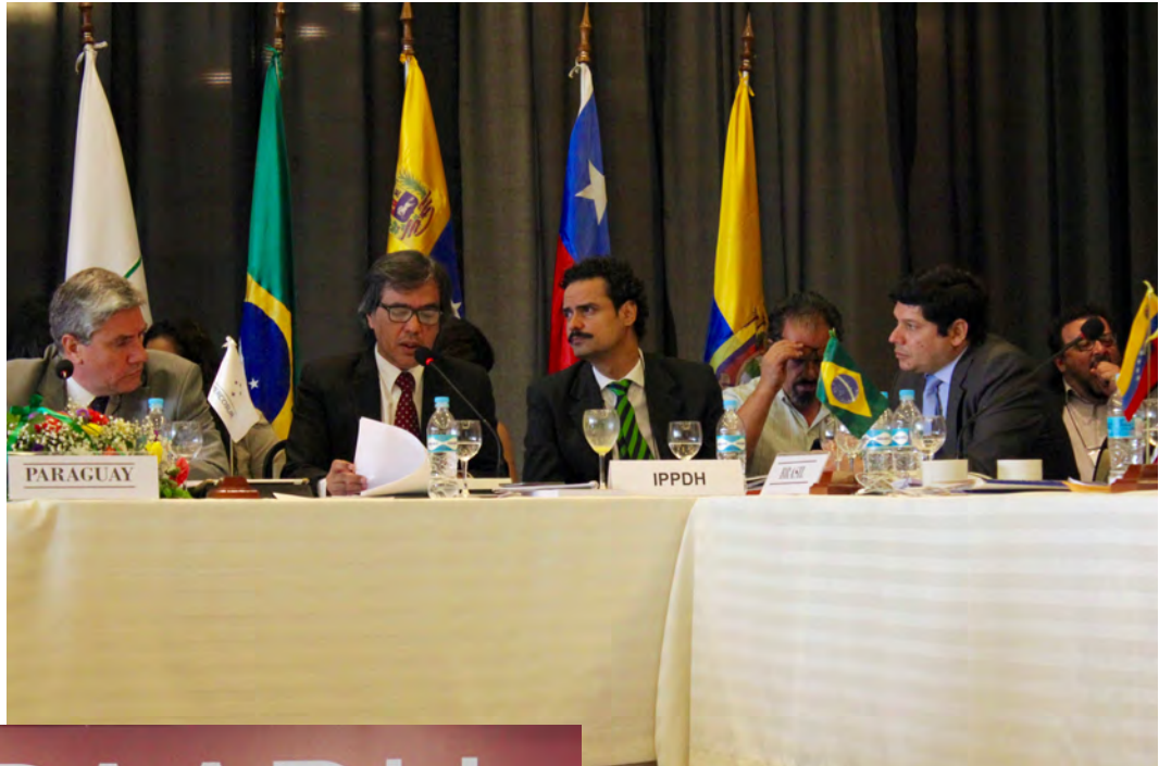
RAADH | Asunción | 25 y 26.11.2015