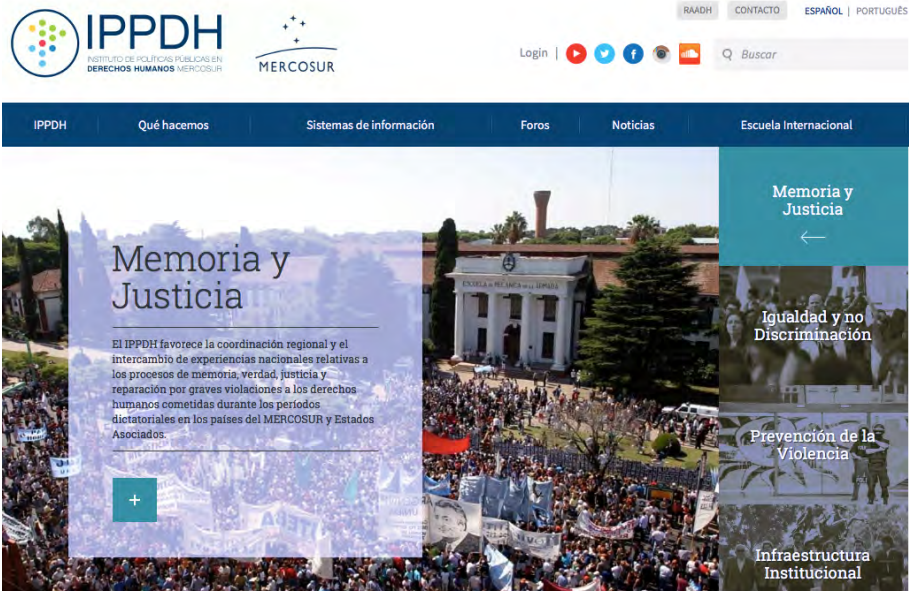
Página WEB del IPPDH: www.ippdh.mercosur.int