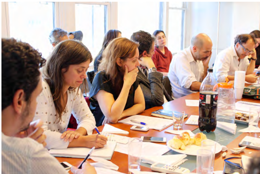
Reunión de expertos en derechos humanos | Buenos Aires | 12.5.2015